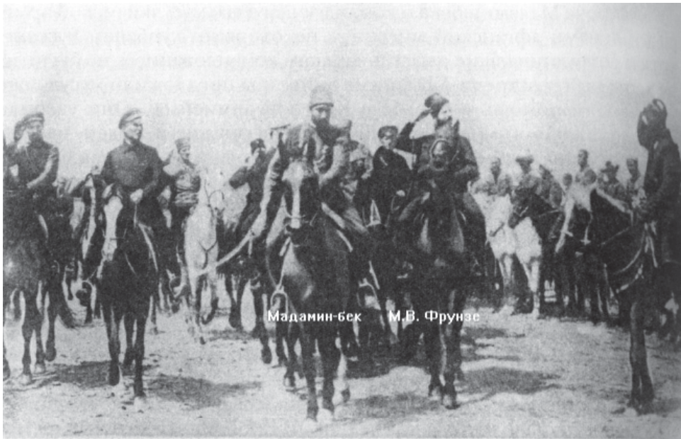
Рисунок 4 – Мадамин-бек и М.В. Фрунзе